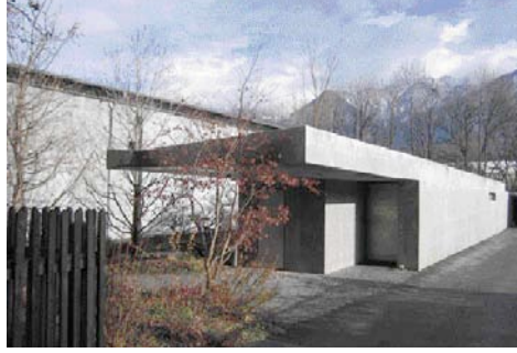
Woning Haldenstein. Peter Zumthor