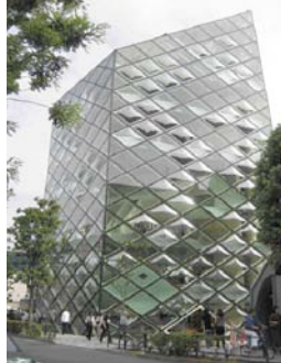
Prada Tokyo. Herzog & de Meuron