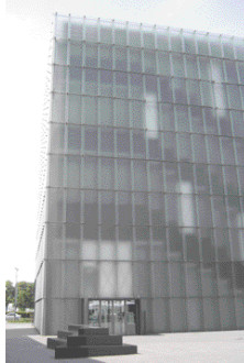
Kunsthhaus Bregenz. Peter Zumthor