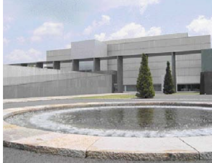
National Museum Tokyo. Yoshio Taniguchi